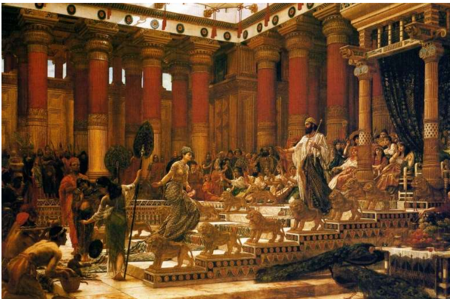
Edward Poynter, The Visit of the Queen of Sheba to King Salomon (1890, Art Gallery of New South Wales)