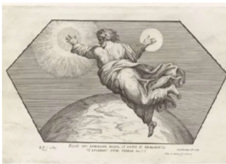
God scheidt de zon en de maan; door Cesare Fantetti, 1675