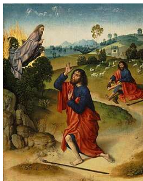
Mozes luister naar de brandende bramenstruik, door Dirk Bouts 1465

zegenbede, met aansluitend lied 415, c. 3