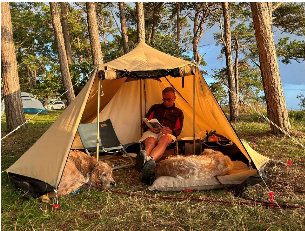
Zweden, Öland, zomer 2023

En er komt een vakantie aan. Dat is toch ook erg fijn. Het wordt gewoon kamperen. Met de tent die ik heb gekregen bij mijn afscheid van de gemeente in Wormerveer. Het is een ESVO-tent uit Volendam (voor de kenners: de Madan). Een heerlijke tent waar wij ook nog in kunnen zitten als het slecht weer is. Onze twee honden gaan ook mee. De oudste heet Dora. Ze is al 11 jaar oud en we vragen ons af of ze nog wel met ons door de bergen kan lopen. We gaan het proberen. En als het niet lukt, dan passen we ons programma aan. We gaan naar een rustig dal in Oostenrijk. En dan zien we wel waar we uitkomen. Als het niet al te warm is, dan gaan we misschien ook nog even naar Italië. Dat is altijd prettig. Onze jongste hond heet Tosca. Die is bijna 2 jaar, heel vrolijk en levenslustig. Allebei houden ze heel veel van eten en slapen.