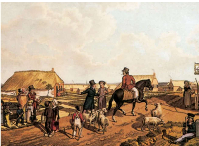
Tekening van H.P. Oosterhuis uit de zomer van 1823 ( wandelingen van Jacob van Lennep