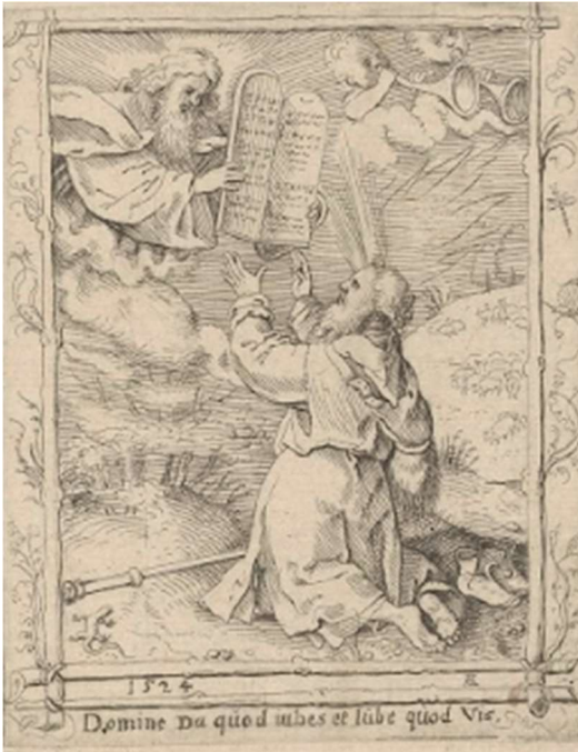
Anoniem, Mozes krijgt de 10 geboden, ca 1524