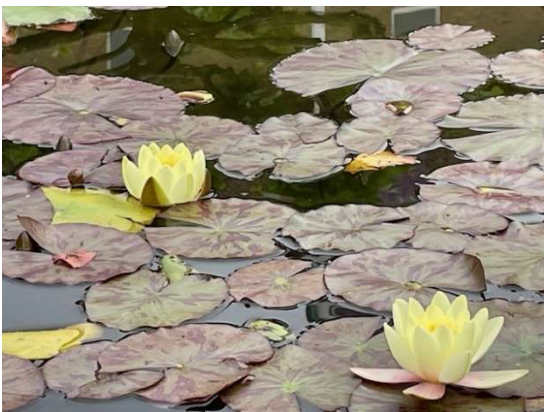
Bloemen in de vijver bij de kapel van Berg en Bosch

Makers markten op de Kaasmarkt in Purmerend op de zaterdagen 29 juni, 28 september en 14 december: Laag Hollandse Makersmarkt | Laag Holland