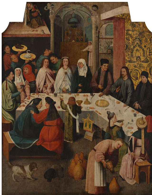
Bruiloft in Kana van Jheronimus Bosch