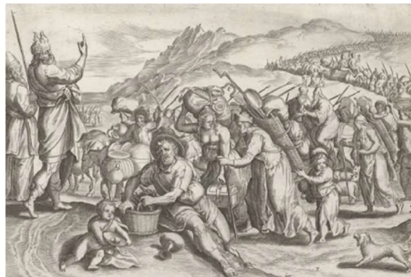
Figuur is de uittocht uit Jeruzalem van Johann Sadeler, 1579